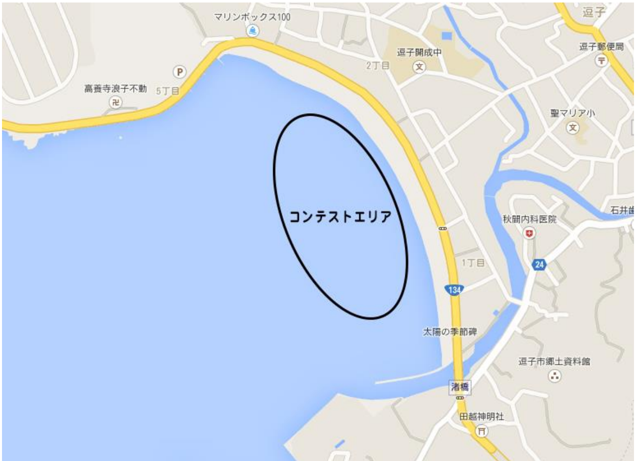
□図1：コンテストエリア